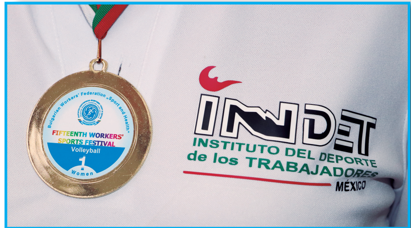
Medalla 1er Lugar VolleyBall Femenil

Es por ello que para ellas es vital que se aumente el fomento al deporte de los trabajadores para que exista una mayor competitividad y por su parte, transmitir su propia experiencia con sus compañeros y los trabajadores interesados, ya que todavía hay mucho talento obrero en Querétaro.