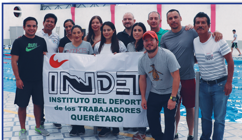
Equipo representativo de Natación del Estado